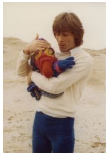
Poppen van Jan de Noord >