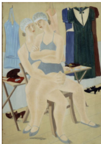
Leven tussen droom en daad >